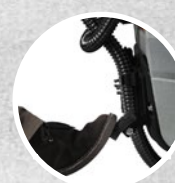
Soulèvement du système d'essuyage à pédale