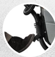
Soulèvement du système d'essuyage à pédale