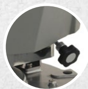
El pomo frontal para regular el ángulo de incidencia del cepillo