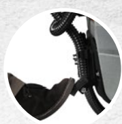
Sistema de elevación del secador con pedal