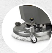
Ruedecilla externa para la regulación del cabezal en altura