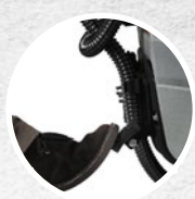
Anhebesystem des Saugbalkens mit Pedal