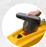
Inspektionsverschlusskappe + Schwimmer + Filter