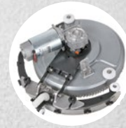
Saugbalken und Rotation (bis zu 270°)