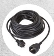
Kabelverlängerung 15 m