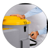
Sistema scuotifiltro manuale