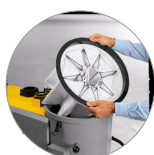
Sistema de filtración