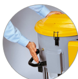
Sistema scuotifiltro manuale