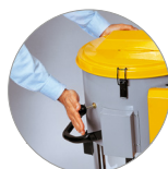
Vibrador filtro manual (opcional)