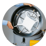
Sistema de filtración