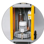
| Turbine |