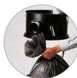
Espaciador para manga de plástico (opcional)