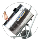
Sistema basculante CBM