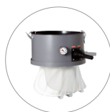
Vibrador filtro manual (opcional)