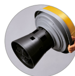
Soporte bolsa tipo jaula con flotador