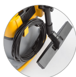
Nuevo gancho trasero de la manguera