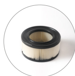
Filtro de cartucho