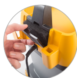
Filtro aire de escape