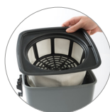
Filtro de poliéster tipo canasta (Versión FT)