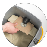
Filtro de manga de papel ecológico