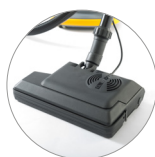
Cepillo de potencia (opcional)