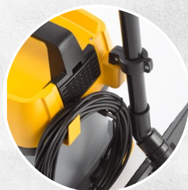
DISPOSITIF DE SUPPORT POUR LES ACCESSOIRES ET LE CÂBLE

SAC FILTRE EN PAPIER + FILTRE TEXTILE OU À CARTOUCHE + FILTRE ÉVACUATION D'AIR