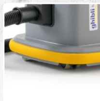
GARNITURE PARE-CHOC EN CAOUTCHOUC ANTITRACE