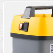
POSSIBILITÉ DE RACCORDEMENT À L'ÉLECTRO- BROSSE