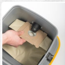
ECOLOGICAL PAPER FILTER BAG