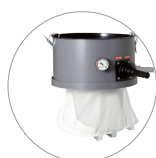
Vibrador filtro manual (opcional)