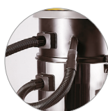
Espaciador para manga de plástico (opcional)