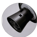
Soporte bolsa tipo jaula con flotador