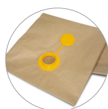
Filtro de manga de papel con tapa (opcional)