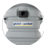
Depósito de plástico resistente a los impactos