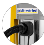
Bocchetta Ø 90 (AS 40 KS)