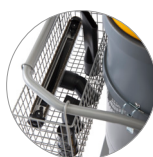
Pratico porta accessori