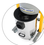
Fusto inox sganciabile