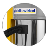
Bocchetta Ø 50 (AS 40 KS M/H)