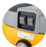
Aspiratore con 3 motori