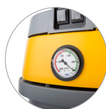
Manometro misuratore filtro intasato