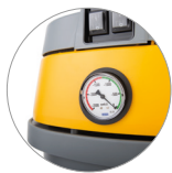
Manómetro medidor filtro obstruido