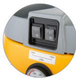
Aspirador con 3 motores