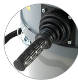
Vibrador filtro manual