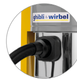
Boquilla Ø 90 (AS 40 KS)