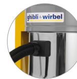
Boquilla Ø 50 (AS 40 KS M/H)