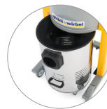
Depósito desmontable de acero inoxidable